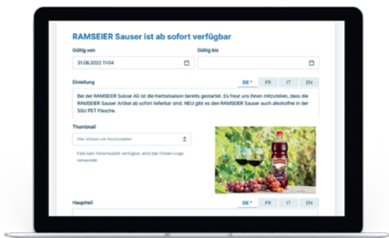
Einfach zu bedienende Oberflächen ermöglichen es Herstellern, eigene Nachrichten zu publizieren.